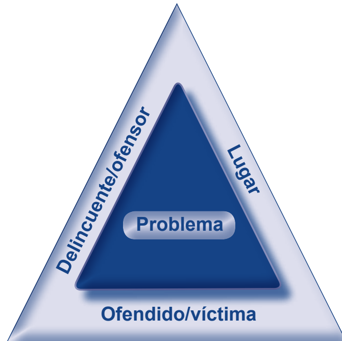
Figura 1. Triángulo del delito

Para el análisis del problema se deben tener en cuenta los siguientes elementos tanto del delincuente, lugar y víctima a fin de conocer a fondo el incidente: