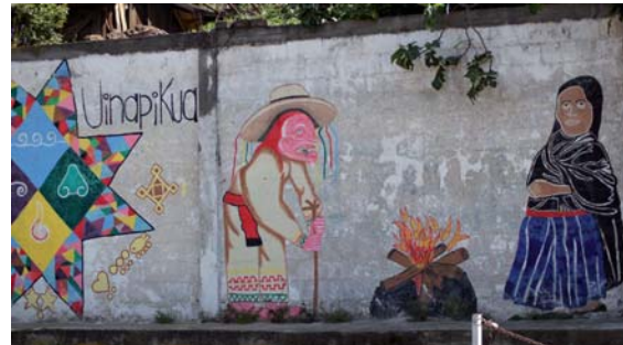
> Figura 1. Graffiti que ilustra la participación de las mujeres en Cherán, en la instalación de fogatas junto con otros símbolos purépechas.

La población levantada enfrentó y expulsó a los talamontes armados y se organizó, ante el temor de represalias, en guardias de vecinos por cuadradas a las que denominaron "fogatas", dado que se encendieron piras con el fin de aglutinar a los vecinos y pernoctar, realizando turnos de vigilancia por cada 12 horas. Cerraron los accesos de entrada al pueblo y utilizaron un sistema de alerta por cohetes para avisar sobre alguna eventualidad. Se constituyeron cerca de 200 "fogatas" en todo el pueblo.