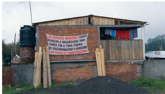
> Figura 3. Espacio comunal donde se aloja la Ronda Comunitaria de Cherato.

En marzo de 2013 los grupos delincuenciales secuestraron al encargado del orden de Cherato como represalia por no acceder al pago de las extorsiones. Esta situación detonaría la formación de la Ronda Comunitaria en estas cuatro localidades para defenderse de la presencia del crimen organizado y al mismo tiempo para continuar con las demandas comunitarias de infraestructura y servicios. Una de las primeras acciones que realizaron ya como Ronda Comunitaria, fue el cierre de la carretera que conecta el valle con la sierra, se instalaron puestos de control que permitían vigilar los accesos a las comunidades. Dicha acción sin embargo, afectaba la libre circulación de los habitantes de las comunidades vecinas, que en algunos casos ven con cierta desconfianza la organización de Cherato.