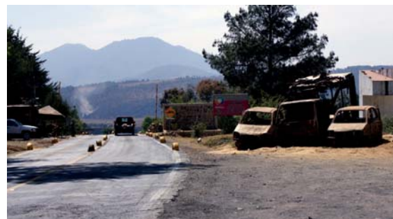
> Figura 2. Puesto de control de la Policía Comunitaria en la carretera que comunica a Cherán.

Como máxima autoridad se encuentra la Gran Asamblea de la Comunidad (K'ERI TANGURHIKUA), en línea directa se encuentra el Consejo Mayor de Gobierno y los Cuatro Barrios. Existe en el organigrama del gobierno autónomo un Consejo Operativo Principal y la Tesorería. Del Consejo Mayor se desprende el Consejo de Administración Local, Consejo de Asuntos Civiles, Consejo de Programas Sociales, Consejo de Barrios, Consejo de Bienes Comunales, y Consejo de Procuración y Vigilancia; a este último se supedita la actuación de los cuerpos de policía comunitaria y guardabosques.