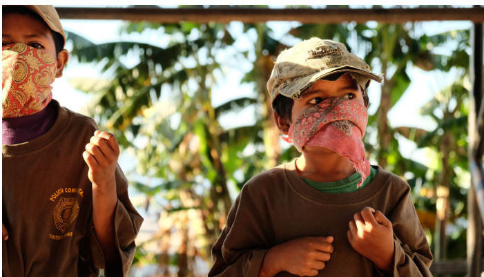
FIGURE 2 Presentación de niños entrenándose.