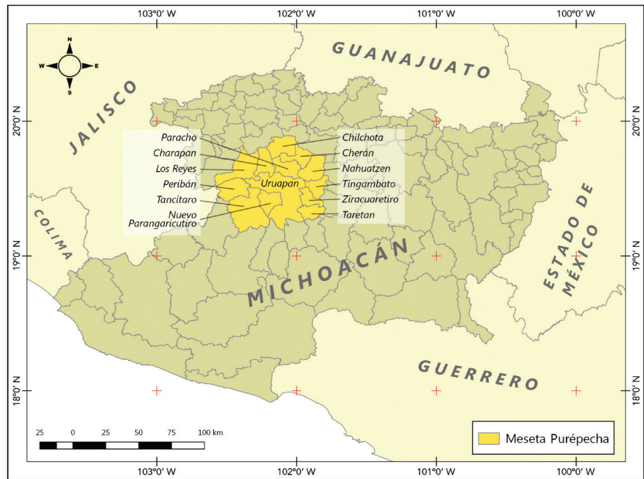
■ Figura 2. Municipios de la región Meseta Purépecha. Figure 2. Municipalities of the Purepecha Plateau region.

acumulación criminal de capital, que utiliza la efectividad de la zona gris, entre legalidad e ilegalidad, como arena para el simultáneo incremento de valor y control.