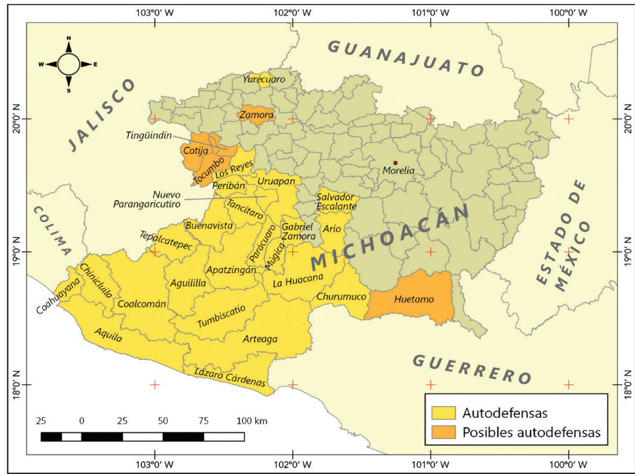
■ Figura 3. Municipios de Tierra Caliente y costa con presencia de grupos de auto-defensa. Figure 3. Municipalities of Tierra Caliente and costa with presence of self-defense groups.

Tepalcatepec, dada la presencia carismática de José Manuel Mireles, entonces vocero de los grupos de autodefensa, quien es originario de este municipio. Tepalcatepec, fue un punto importante en el modelo de desarrollo regional en la época del Cardenismo. Hacia los años setenta del siglo XX, fue una zona importante para la producción de cultivos como sorgo, maíz y algodón (Calderón-Mólgora, 2001). De igual manera, en los ochenta, se fue convirtiendo en un importante centro de actividades ganaderas, con una alta producción de leche, queso y carne para la exportación. En su territorio se instalaron dos presas: Los Olivos y la Constitución de Apatzingán. La segunda posee una central hidroeléctrica que distribuye la energía a cuatro estados: Jalisco, parte del estado de Michoacán, Querétaro y Colima. En los años noventa, con el establecimiento de la Presa Constitución, se establecieron huertas de guanábana y aumentó la producción por riego del limón y mango para la exportación hacia Japón, así como el cultivo de Tilapia (Angón-Torres, 2001).