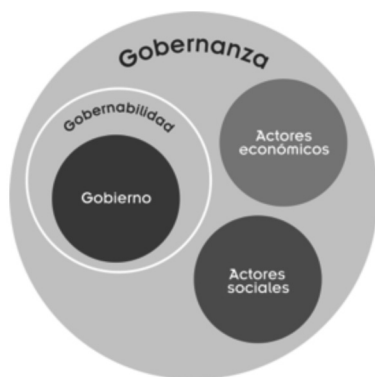
Figura II Elementos para diferenciar los conceptos de gobierno, gobernabilidad y gobernanza