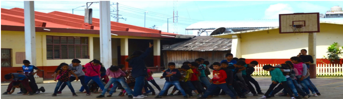
Foto 2. “El lobato escucha y obedece la ley de la manada, y el lobato se vence a sí mismo”.

La formación en filas permitió que los equipos se autorregularan. Los líderes de cada equipo debían propiciar que sus compañeros y compañeras estuvieran en orden y en silencio; cuando lo lograban, gritaban “(nombre del color) siempre”, “lo mejor” y, de este modo, iniciaban los juegos. Esto ayudó a fortalecer el sentido de pertenencia y a sensibilizarlos acerca de la importancia de estar en orden y atentos para participar mejor en los juegos.