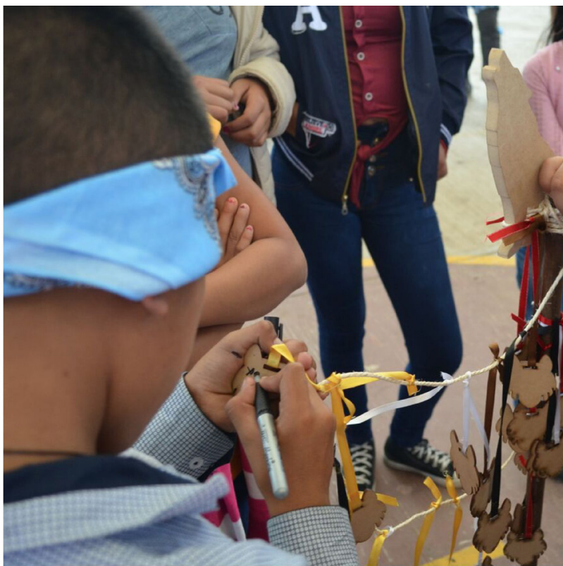
Foto 1. “Todos somos de la misma sangre, nos cuidamos y nos apoyamos” (autora: Ángeles Eugenia López Herrera)

Una vez que finalizaron el proceso para encontrar a su equipo y su color, les pedimos que cada equipo hiciera una fila de frente a la facilitadora que tenía un tótem en su mano. El tótem era un palo de escoba decorado, que tenía un lobo de madera en la punta superior. Cada participante escribió su nombre por su propia mano o con ayuda de alguien de su equipo en el listón con el que se había quedado, y después de manera ordenada, por equipo amarraron su listón en el tótem. Antes de anotar su nombre se les preguntaba si querían estar en ese equipo o si querían unirse a otro equipo. Esto simbolizaba la unión de todos los participantes en un objetivo común, y que el trabajo y el juego lo realizaríamos en equipos. Durante esta actividad mientras anotaban sus nombres en los listones y los amarraban al tótem, el facilitador líder del grupo (Akela) presentó las ideas principales del Libro de las Tierras Vírgenes para introducirlos en el mundo de fantasía que vivirían durante el taller (diario de campo, sesión 1).