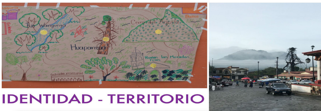
Foto 3. Mapa del tesoro y vista del pueblo.

El segundo fue una fiesta con pizzas que habían solicitado desde la primera asamblea, dado que las fiestas son una práctica muy frecuente y significativa en el pueblo, así que se programó la actividad el último día. Entre ellos decidieron que se daría una cooperación, sin establecer una cuota mínima, y lo que se juntara sería para comprar y compartir pizza; después, cada uno podría llevar películas, guitarra, balón y música y unirse a esas diversas actividades. Días antes de la fiesta, llevaron su cooperación, lo que cada uno pudo dar: