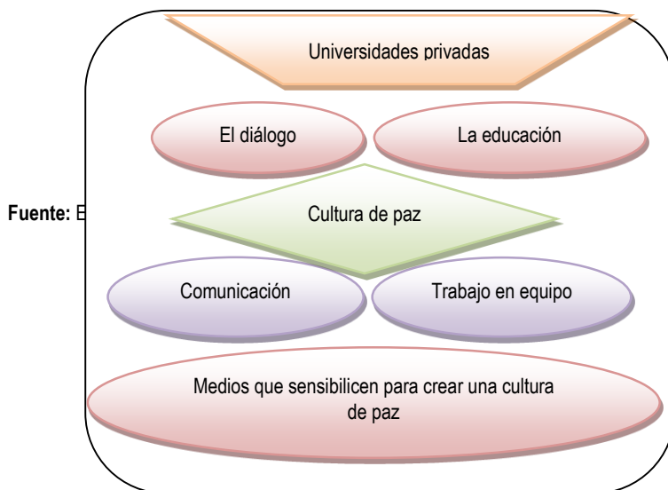
Figura 3 Medios para internalizar un cambio de conducta.