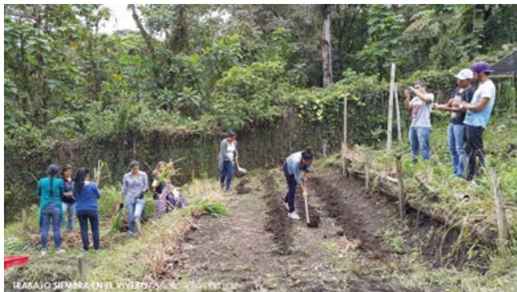
TRABAJO SIEMBRA EN EL VIVERO/ PROYECTO NIMDES1 UCM