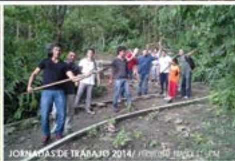
JORNADAS DE TRABAJO 2014/ PROYECTO NIÑESKI UOM