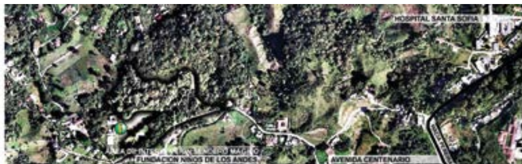
UBICACIÓN FUNDACIÓN NIÑOS DE LOS ANDES/ EDICIÓN DE AEROFOTOGRAFIA IGAC