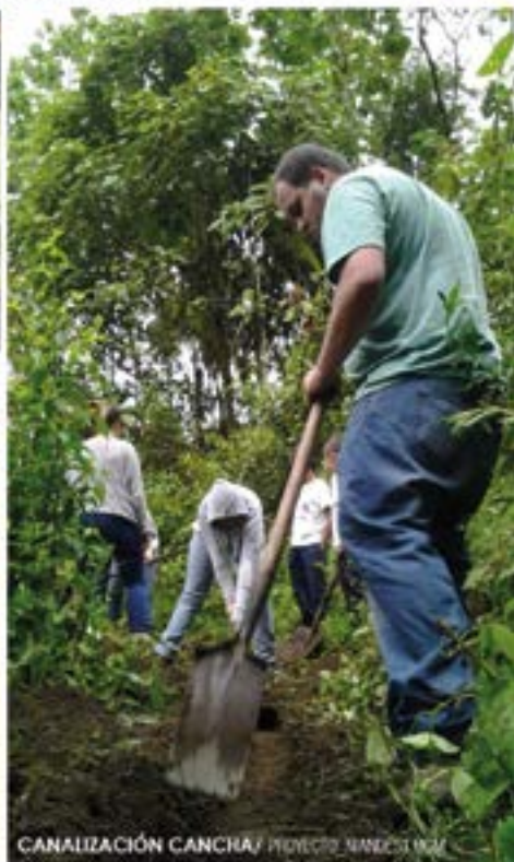
CANALIZACIÓN CANCHA/ PROYECTO NIMDES1 UCM