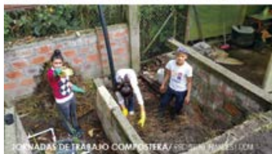
JORNADAS DE TRABAJO COMPOSTERA/ PROYECTO NIMDES1 UCM