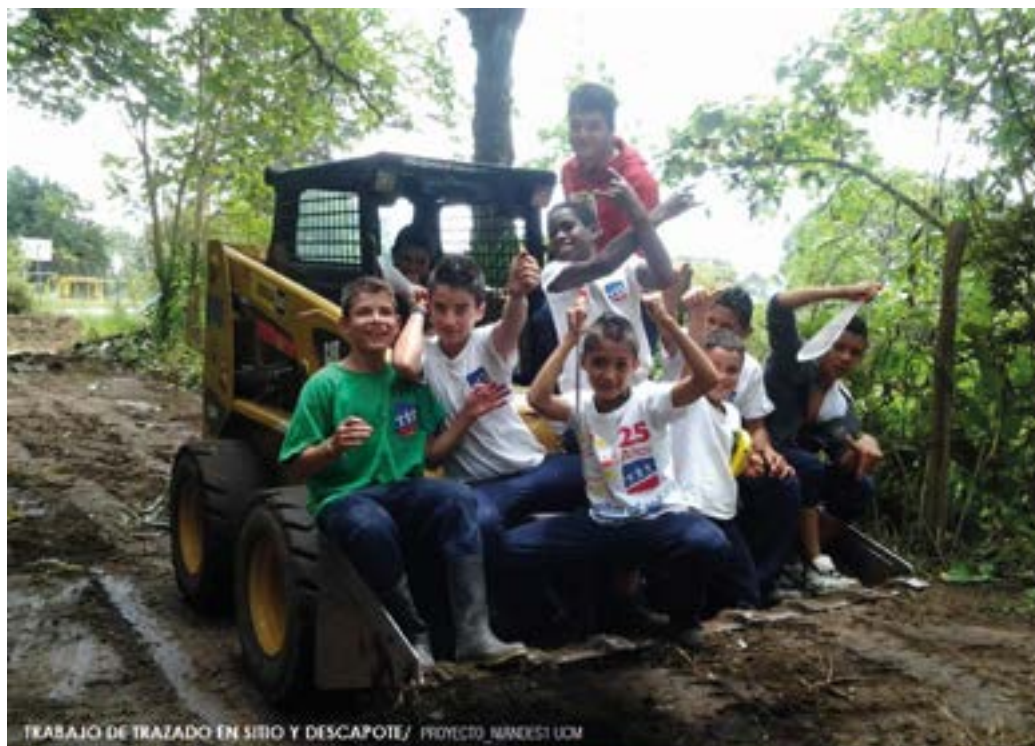
TRABAJO DE TRAZADO EN SITIO Y DESCAPOTE/ PROYECTO NIÑESKI UOM