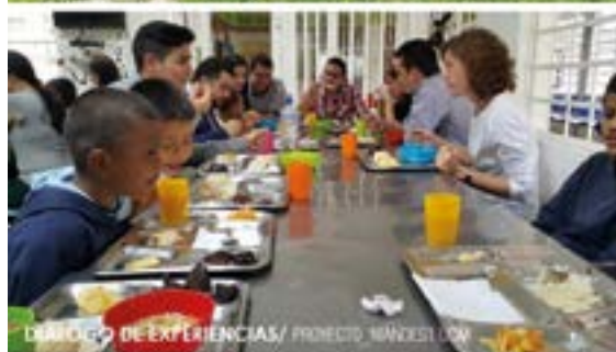
DIÁLOGO DE EXPERIENCIAS/ PROYECTO NIÑESKI UOM