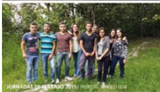
JORNADAS DE TRABAJO 2015/ PROYECTO NIÑESKI UOM