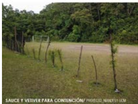
SAUCE Y VETIVER PARA CONTENCIÓN/ PROYECTO NIMDES1 UCM