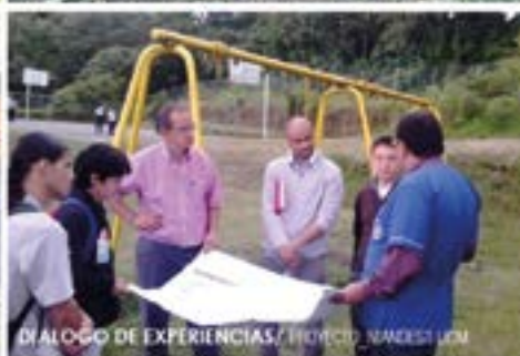
DIÁLOGO DE EXPERIENCIAS/ PROYECTO NIÑESKI UOM