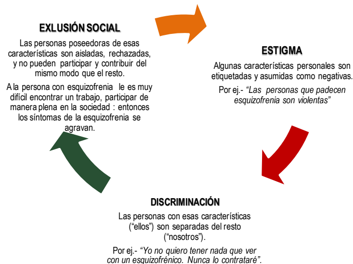
Cuadro 2: Ciclo del Estigma.