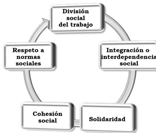
Figura 1. Ciclo virtuoso de la solidaridad social.

Durkheim formuló la idea de que a mayor división social mayor interdependencia habría y, por ende, mayor necesidad de interactuar y de asumir la conveniencia de una estrecha vinculación. A esto le llamaba solidaridad orgánica (Durkheim, 2008), de la cual se desprende que la interdependencia constituye la matriz donde se propicia la cohesión y, por tanto, cuanto menor interdependencia exista menor cohesión se identificaría (figura 1).