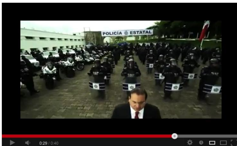
Imagen 2. La cámara baja y descubre que delante de los policías formados se encuentra el gobernador.

En términos de microestructura, un primer análisis semántico del texto oral muestra que la palabra violencia no aparece. En su lugar se utiliza "el fenómeno nacional de la inseguridad". Esta expresión refleja una continuidad con respecto a la imagen que la prensa intentaba transmitir sobre los hechos violentos durante la administración anterior, cuando el gobernador era Fidel Herrera Beltrán, y los periódicos veracruzanos insistían en que la violencia "venía de afuera" (del Palacio, 2012: 38). Al ser presentada como un fenómeno "nacional", se le confiere al concepto de violencia un sentido de inevitabilidad. Si es un problema nacional y Veracruz está en la nación, se infiere que el problema también tiene que afectar a este estado. Se infiere, también, que su origen no es veracruzano. En cuanto al uso del silencio, se omite que aunque el problema sea nacional, estados que tienen frontera con Veracruz como Puebla, Tabasco y Oaxaca no se han visto afectados por esta explosión violenta.