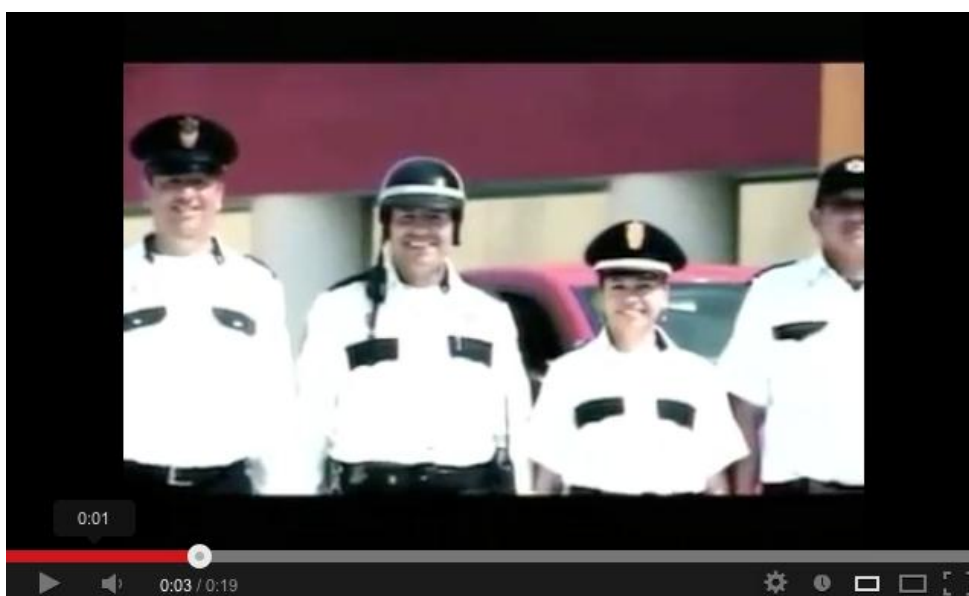
Imagen 7. Agentes de policía de Córdoba sonriendo.

tránsito, tres hombres y una mujer, de pie y sonriéndole a la cámara. Los tres visten con una camisa blanca. Uno de los hombres y la mujer lleva una gorra de plato, el otro un casco de motociclista con la correa del mentón desatada y el cuarto, una gorra de béisbol (Imagen 7). Otro policía mira directamente a la cámara de manera seria con las luces de un coche policial prendidas en el fondo. Dos hombres entran al centro, pasando entre una escuálidas palmeras recién plantadas. Una funcionaria policial detrás de un mostrador los atiende con una sonrisa. Otro policía, con la gorra encima del escritorio, atiende a una pareja y les estrecha la mano.