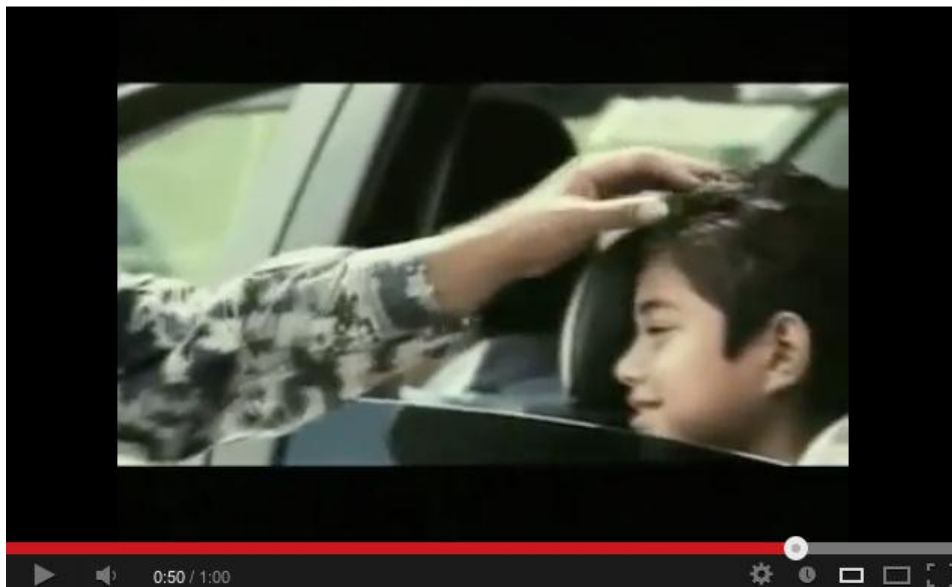
Imagen 6. Un soldado acaricia la cabeza de un niño en un retén militar.

marino se pone serio ante el próximo coche porque no sabe (y el público tampoco) de qué tipo de coche se trata ni quién lo maneja. El mensaje ya ha quedado plasmado: si es una persona honesta y que, como el resto de los veracruzanos, sonrío, no tendrá problemas en el retén.