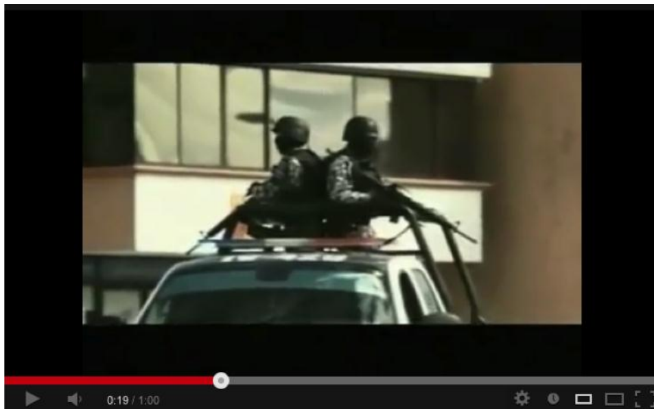
Imagen 5. Una patrulla militar circula por las calles de Veracruz.

Cuando el locutor pronuncia estas palabras, el soldado acaricia la cabeza del hijo (Imagen 6). El coche arranca, el hijo saca la cabeza por la ventana, mira hacia atrás sonriendo, y le hace adiós con la mano al soldado. El soldado le corresponde el saludo y se voltea hacia la cámara. Allí desaparece su sonrisa, se pone serio, y con la mano le hace señales al próximo coche para que se acerque. El video finaliza con el logo del Gobierno del Estado.