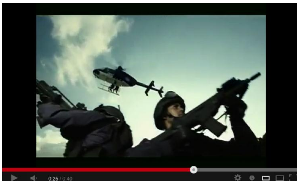
Imagen 4. Dos policías y un helicóptero filmados desde un ángulo inferior.

VIDEO 3. Gobierno del Estado de Veracruz. Operativo Veracruz Seguro. 60 segundos. (Gobierno del Estado de Veracruz, 2012a) 2 .