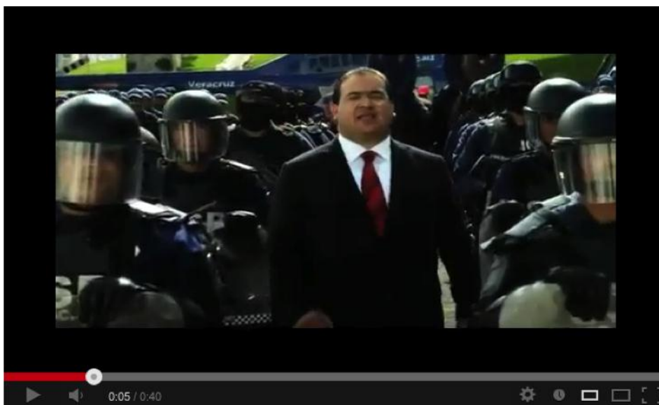
Imagen 1. El gobernador camina entre policías antimotines en un video oficial de YouTube.

Durante el video, se escucha la voz del gobernador con música de fondo. Se trata de una orquesta sinfónica, con percusión y un coro, tal vez real o tal vez generado por sintetizador. La percusión marca el ritmo y le da un aire de paso militar encubierto. Este aspecto marcial contrasta con el legato (o sea, "ligado") de los instrumentos de cuerda, que le dan un sonido amplio y de grandeza. Hay un crescendo global que denota triunfalismo. La música está en tono mayor, lo que hace que sea más brillante. El coro le confiere una dimensión humana, que además de engrandecer el sonido, da la impresión de que mil voces humanas respaldaran el discurso. Sobre la música, el texto que pronuncia el gobernador es el siguiente: