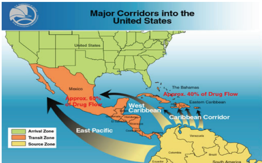
Figura 1 Principales corredores de la droga hacia los Estados Unidos, 2011.