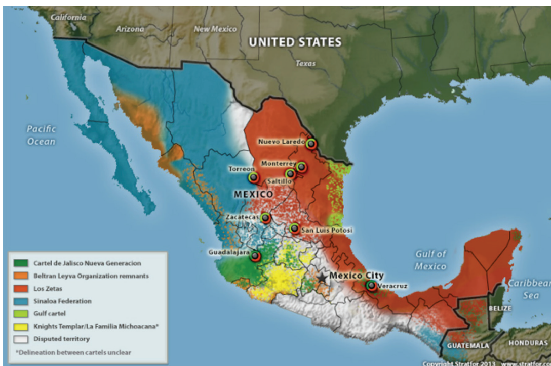
Figura 2 Áreas de influencia de los cárteles de la droga en México, 2013.