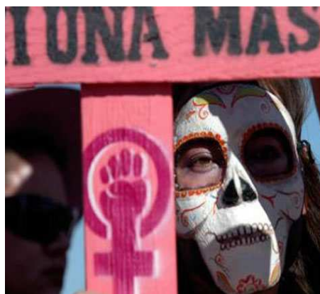
Fig. 4. Ni una más. Anónimo.