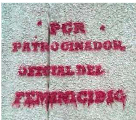
Fig. 3. PGR patrocinador oficial.