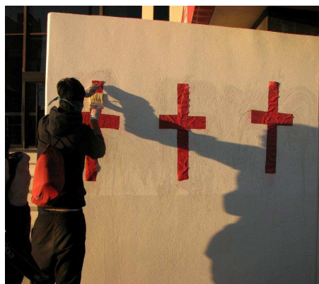
Fig. 2. Manifestación cruces rojas. 2011.