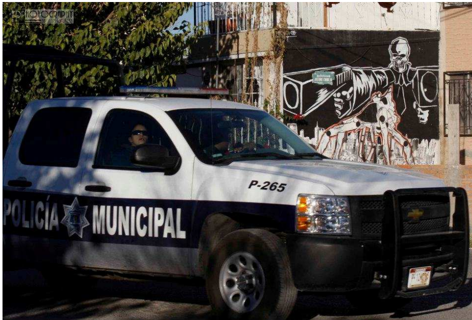
Fig. 7. Sicario, 2009.