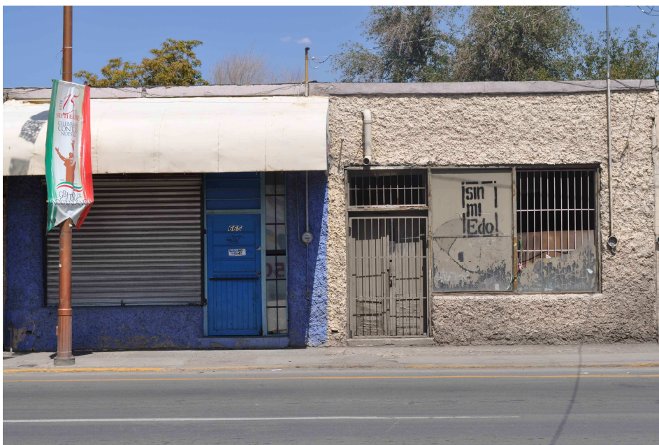
Fig. 8. Sin mi Edo, 2011. Fotografía propia.