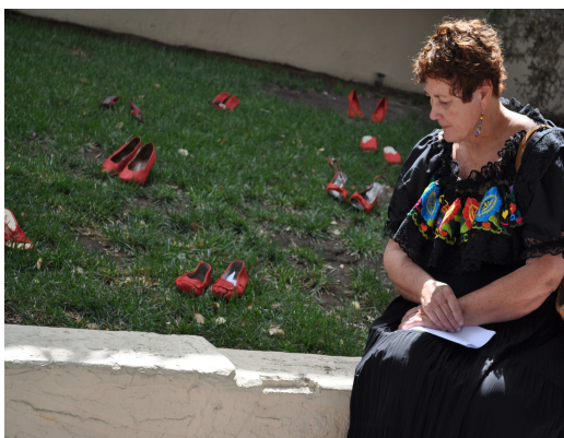
Fig. 1. Zapatos rojos. 2012.