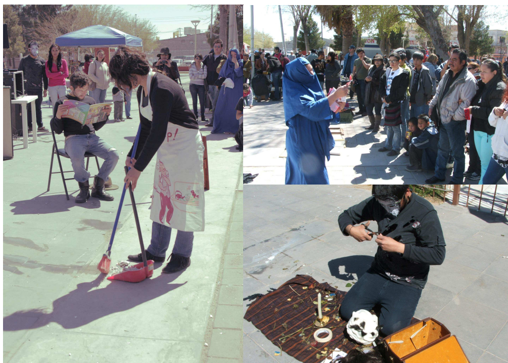
Fig. 6. Performance Juárez, 2012.

grupos que se reúne ahí domingo a domingo donde además aprovechan el espacio y el público para tratar el tema de la violencia contra la mujer a través del performance (ver fig. 6).