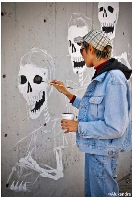
Fig 5. Muralismo, 2010.

Inició por la inquietud de un grupo de amigos, artistas y gestores culturales que se reunieron porque querían tener un tianguis cultural como los que existen en varias ciudades del país, por ejemplo el Chopo 5 en la Ciudad de México. La primera idea que plantearon y que hasta la fecha defienden es que sea en un espacio público. Fue así como pintores, escultores, actores, melómanos, estudiantes y demás actores del campo artístico, establecen el primer bazar cultural en Ciudad Juárez, el cual funciona no solamente de escenario para la compra-venta e intercambio de artículos culturales, sino que además se convirtió en un espacio de encuentro y convivencia como estrategia de sobrevivencia ante el escenario de violencia (ver fig. 5).